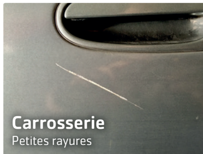
Carrosserie Petites rayures